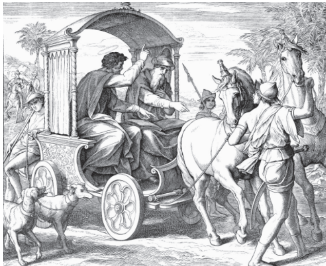
Юлиус Шнорр фон Карольсфельд. Обращение евнуха эфиоплянина (Деян VIII 27-39)