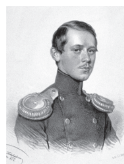
Великий князь Михаил 1852 год

Чем особенно провинился генерал-фельдмаршал, генерал-фельдцейхмейстер, Председатель